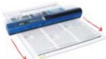
Scanner portatif à défilement

Ce dernier permet à l'enfant d'intégrer les documents du cours directement à la bonne place, plus de feuilles volantes, le travail sur le document numérisé est propre et rapide, l'élève peut lui-même numériser le cours d'un camarade à la fin de l'heure en 1 minute.