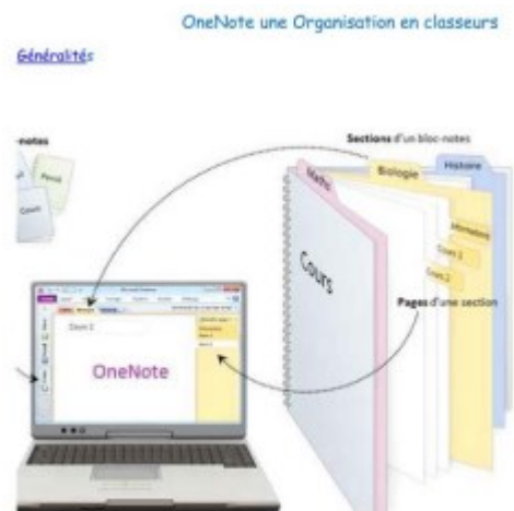
Logiciel Onenote de Microsoft